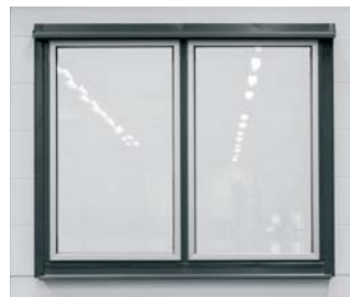
Utsida med plåtbeklädnad