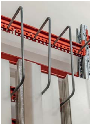
Avdelarbåge (925x500 mm) med fäste