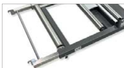
Hakar i framkant på lastbäraren