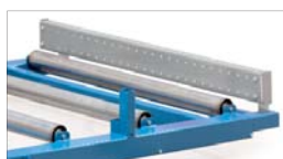
Stopp i bakkant på lastbäraren