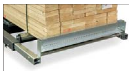
Stopp i bakkant på lastbäraren