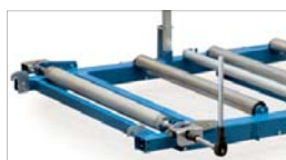
Drivpaket på lastbäraren som underlättar inlastningen

I EAB Lagerinredningar ingår: Pallställ, Djupstapling, Maxipacker, Rullbanor, Utdragsenhet, Grenställ, Virkeställ, Listställ, Hyllställ, Plastlådor, Påkörningsskydd och Arbetsplatsutrustning.