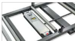
Manöverpanel och batterikassett