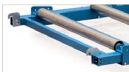
Hakar i framkant på lastbäraren