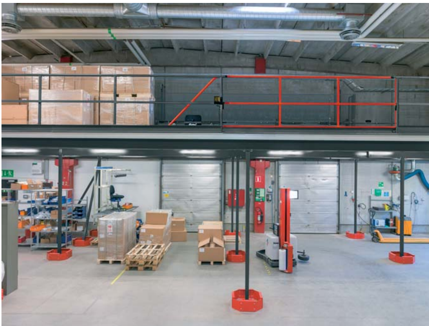
Upplastningsplats med motordriven skjutgrind. Manövrerad via radiosändare