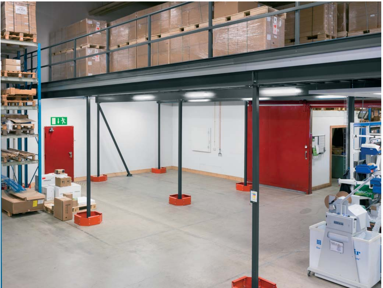
En entresol ger ett extra golvplan och frigör användbar golvyta.