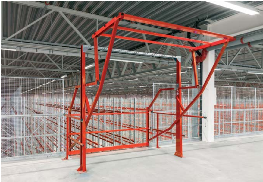
Upplastningsplats med vippgrind