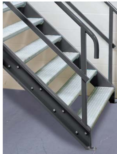
Trappa till entresolplanet. Stegen finns i olika utförande.